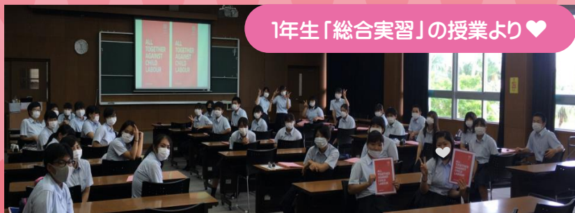
1年生「総合実習」の授業より♥