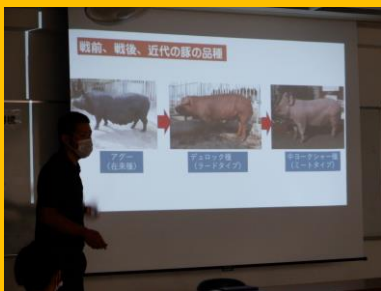
戦前・戦後 豚の品種

戦前と戦後の豚の品種や飼育の違い、戦後にハワイから 沖縄に豚を輸送した事について学び、平和を実感する。