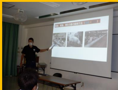
戦前・戦後 豚の飼育方法