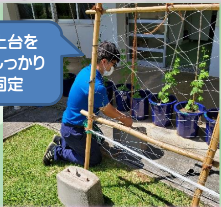
土台を しっかり 固定