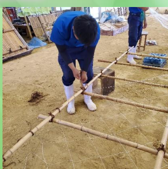
これがイボ結びだー

造園技能検定の技である竹垣の結び方、「イボ結び」を習得しゴーヤーの棚を作りました。ゴーヤー棚は幅3m、高さが4mの大きさです。