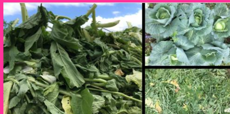
たべられない「やさい」はどうしよう？