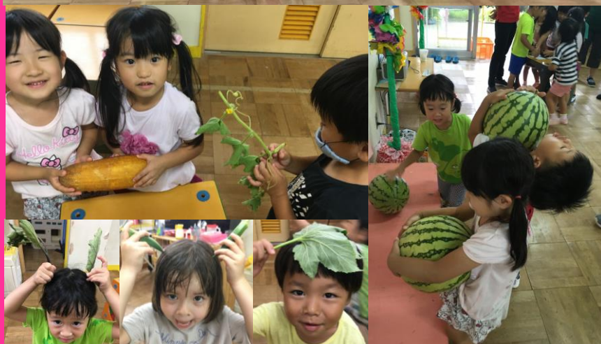
園児の想像力は無限大でステキ♡LOVE