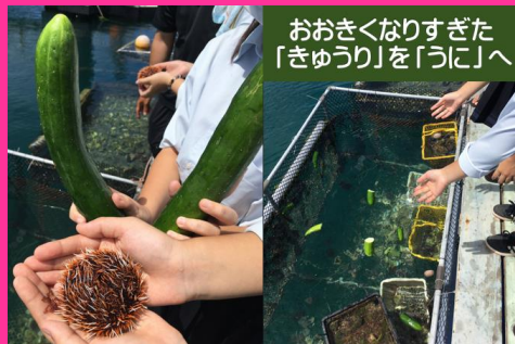
おおきくなりすぎた「きゅうり」を「うに」へ