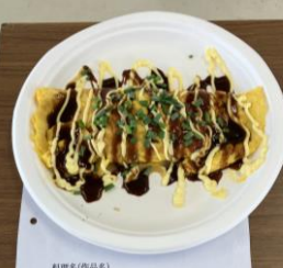
チームゆうすけ 野菜の卵包み