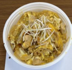
チームFY 3 親子丼