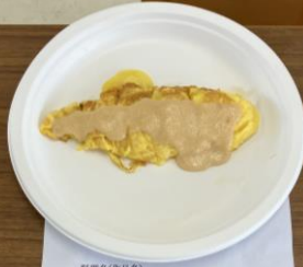
チームFoodGirls チーズ入り卵焼き