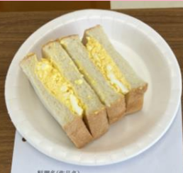
チームUKグループ たっぷり卵サンド