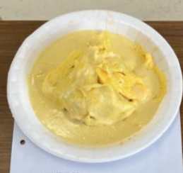
チームUoVo ドレスドオムレツ