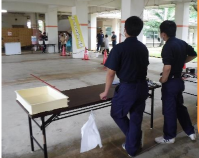
片付けまでしっかり