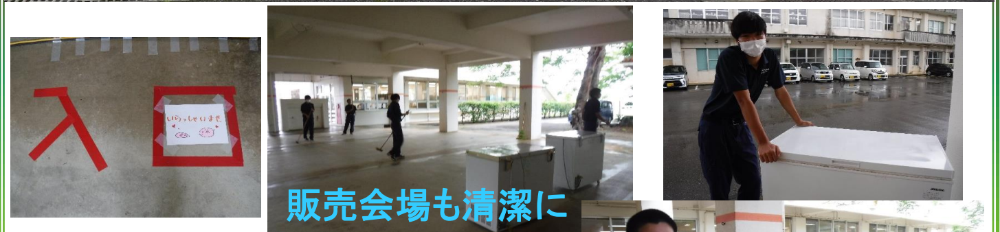
販売会場も清潔に