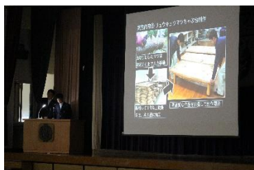
校内農業クラブ大会（プロジェクト発表）