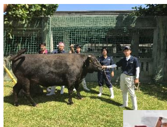
経営者を目指して （石垣牛の肥育）

食肉の生産及び畜加工に関する基礎・基本的な知識と技術を総合的に習得させ、 創造的・実践的な能力と態度を育てる。さらに地域産業に貢献できるとともに、生命を思いやる人間性を養う。