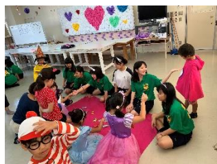
幼稚園児との 交流会

保育・調理を主とし草花・野菜栽培の基礎を習得させ、専門性を活かし実践的な能力を身につけさせる。また、豊かな心と勤労観を育み、 社会に貢献できる人材育成を目指す。