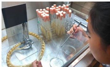
プロジェクト学習（実験風景）

その為、生徒同士の学び合いを重視するため、各教科で、生徒一人ひとりが自らの課題を明確にし、課題解決のための仮説と計画を立て、その実践を通して課題解決に取り組み、さらに次の課題を明確にしていく「プロジェクト学習」の充実を図っています。