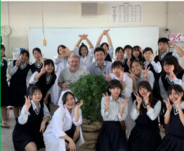
Grazie ♥ Amore イタリア語も学びました Ciao!