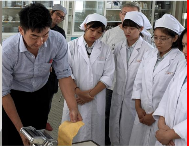
パスタマシーンで麺作りに挑戦