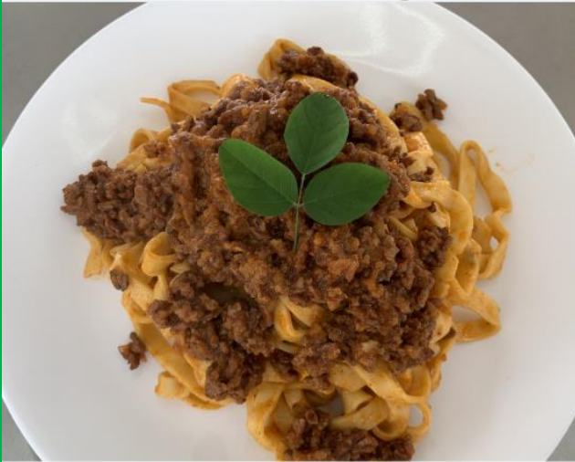
本場イタリアの味【ボロネーゼ】