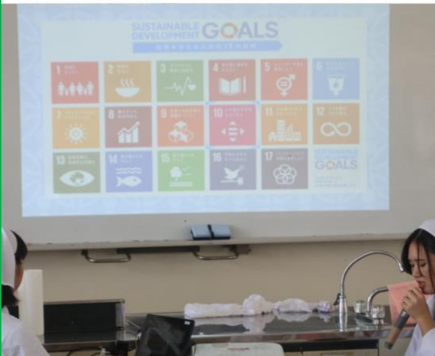
私たちはSDGsの概念に基づいて 持続可能な社会を目指します