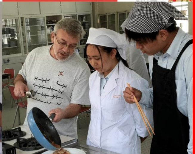
畑で育てたローズマリーを摘んで 【鶏肉のカチャトーラ】 Buono!