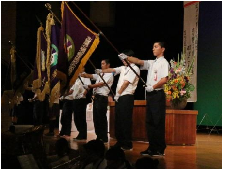
開会式(県連旗・単位クラブ旗)