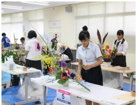
ワカアヅミ 外競技会