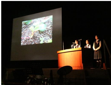
プロジェクト発表会